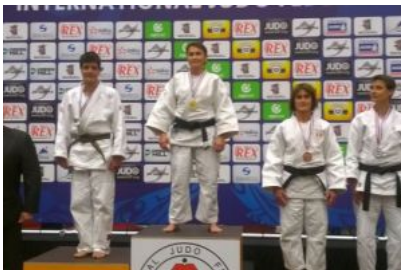
Anita Sprenger wurde VIZEWELTMEISTERIN 2015 ...