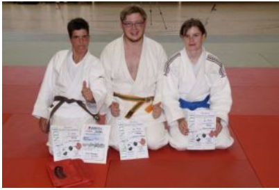
ERFOLGREICH bei den Stadtmeisterschaften 2015 ...