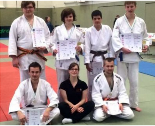
Unsere erfolgreichen Wettkämpfer bei der U21 in Freital 2015 ...