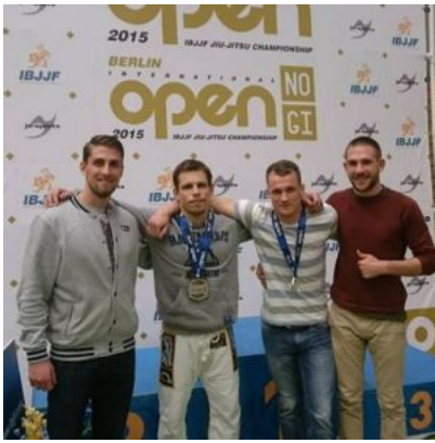
2 x SILBER und 1 X BRONZE in Berlin ..

Unsere 4 Starter der Abteilung Brazilian Jiu Jitsu/ Grappling erzielten zwei Silber- und eine Bronzeplatzierung gegen eine starke europäische Konkurrenz beim "Internationalen Berlin Open 2015 des Weltverbandes IBJJF"