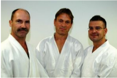
Vorstand tritt zur Vereinswahl am 06.03.2015 wieder an ...