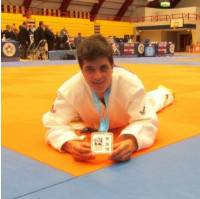
Anita Sprenger – VIZEWELTMEISTERIN 2015