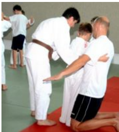
Elternabend auf der Tatami ...