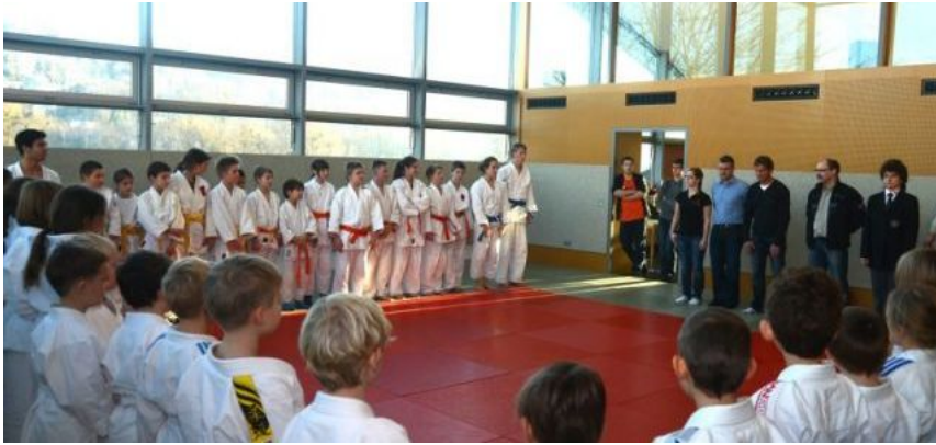
Arashi Weihnachtsturnier 2013