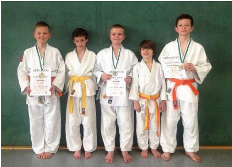
2x GOLD, 1 X SILBER, 2 x 5. Platz beim 28. MIX POLKAL der U12/ U14 in Werdau: